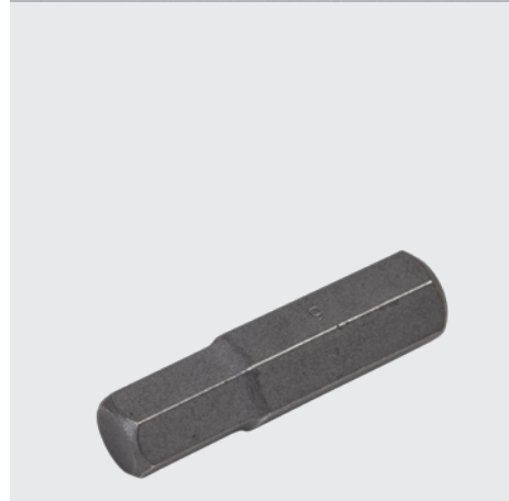
9 mm bits för ISO-skruv

Bits (Insex 9 mm) för ISO-skraven köps till vid leverans av skruvarna.